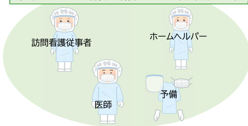
在宅ケアチームに送付する物資のイメージ(1週間分セット)