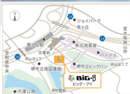
国際障害者交流センター（ビッグ・アイ） 〒590-0115 大阪府堺市南区茶山台1-8-1 TEL 072-290-0900 FAX 072-290-0920